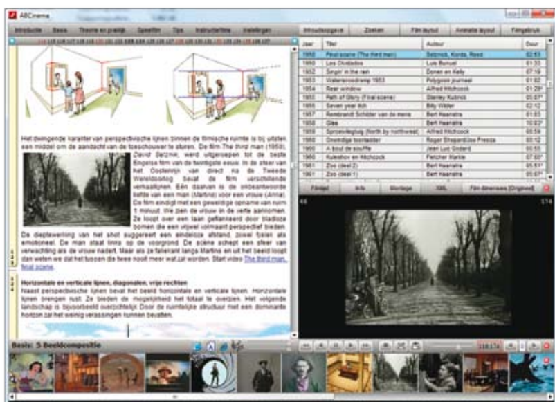
NAVIGATIE: Links vind je het elektronische boek met de teksten, rechts de filmspeler. Je start de filmspeler door te klikken op een link in de tekst of door op de betreffende titel in de lijst rechtsboven te klikken.